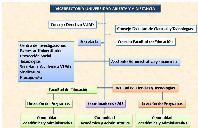
Figura 11.1. Estructura Académico – Administrativa VUAD.